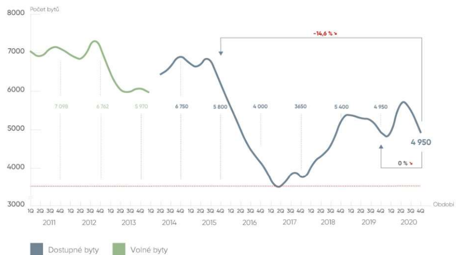
Graf – Vývoj nabídky nových bytů v Praze 2011–2020

Pozn: 1Q 2014 došlo ke změně metodiky. Nabídka se namísto volnými byty začala definovat byty dostupnými (volné + rezervované)